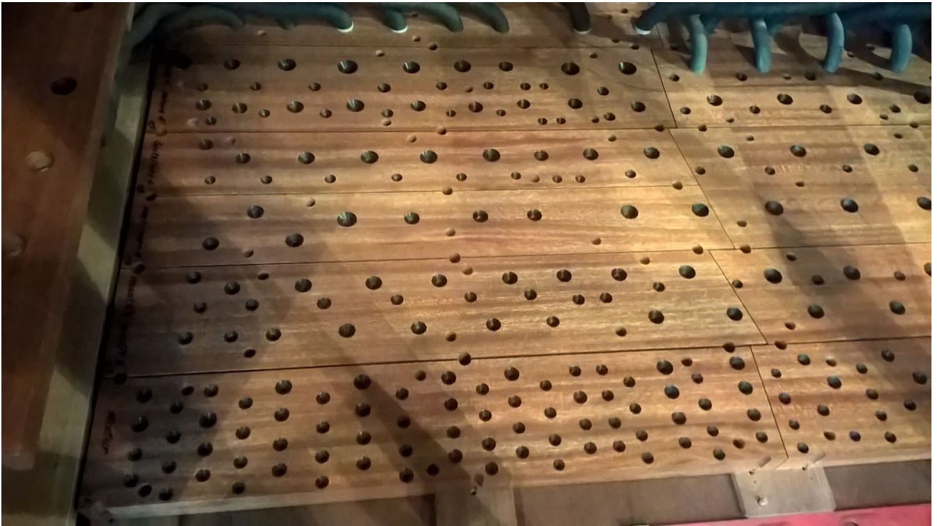
Nach der Reinigung siehts aus wie neu.