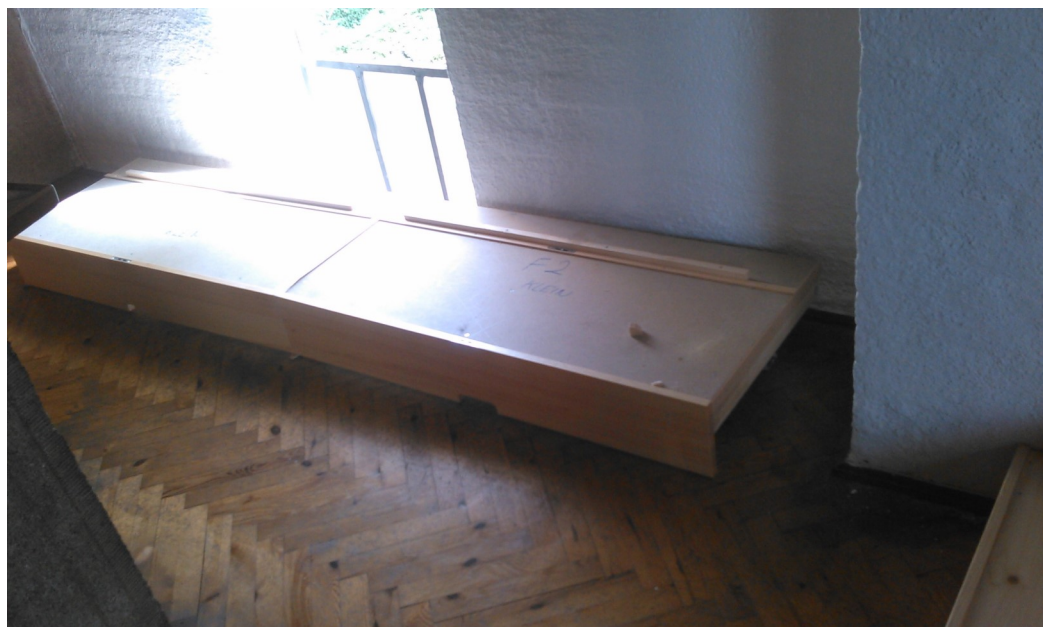
Schiebepodest hinter der Orgel