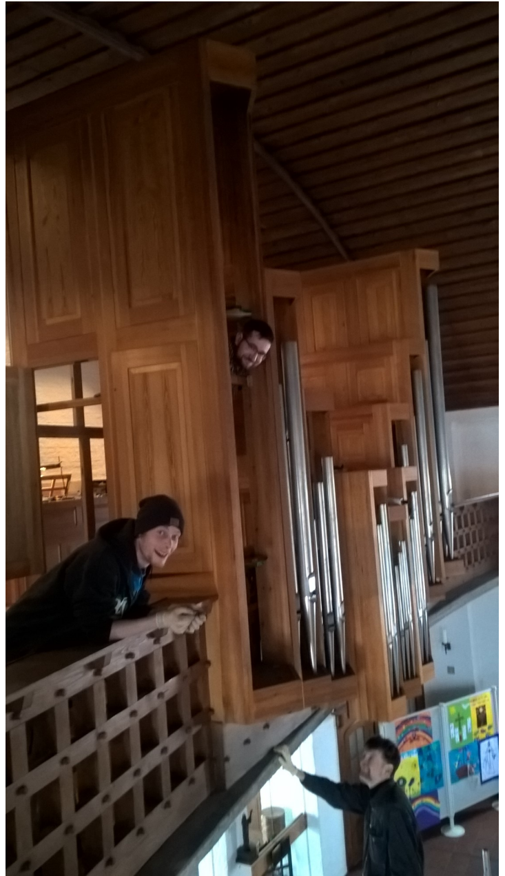
Arbeiten am Prospekt der Orgel von oben und unten