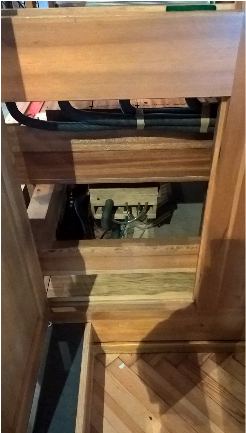
In der Bildmitte der Tremulant des II Manuals