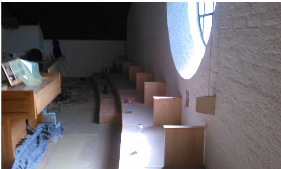
Stufen und Sitzbank werden eingebaut