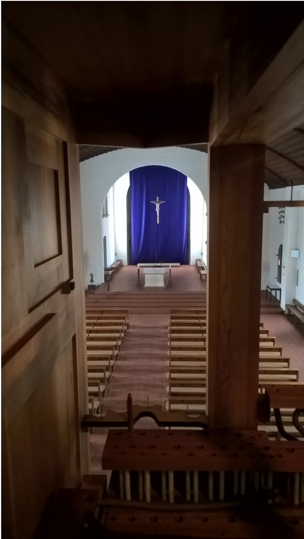
Seltener Blick durch die Orgel zum Altarraum.