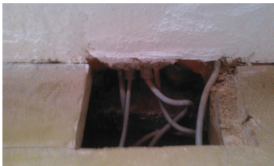
Elektrische Leitungen werden neu verlegt.