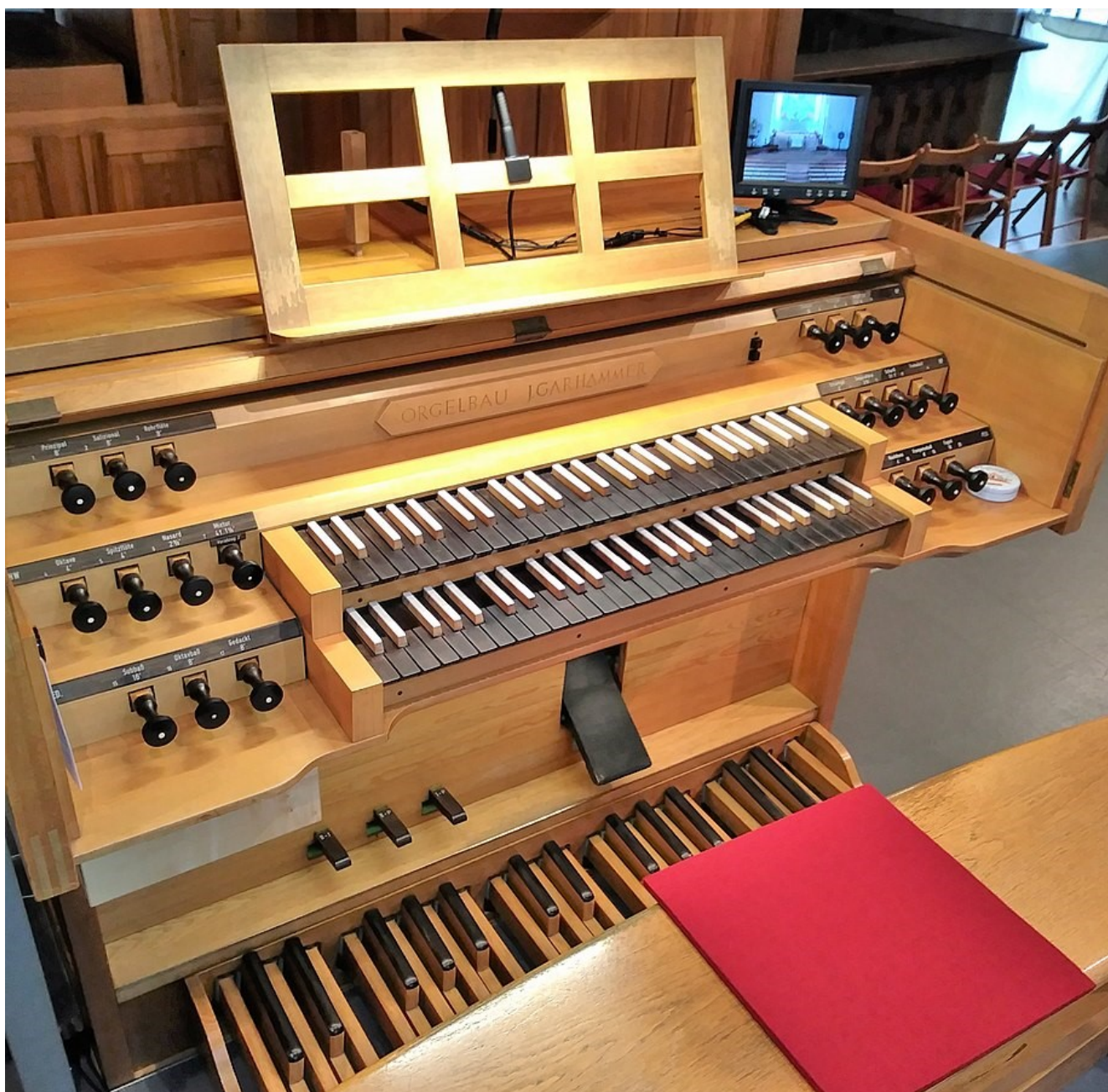
Der gereinigte Spieltisch